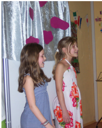
Selbst arrangierter Liedvortrag (Kl. 6)