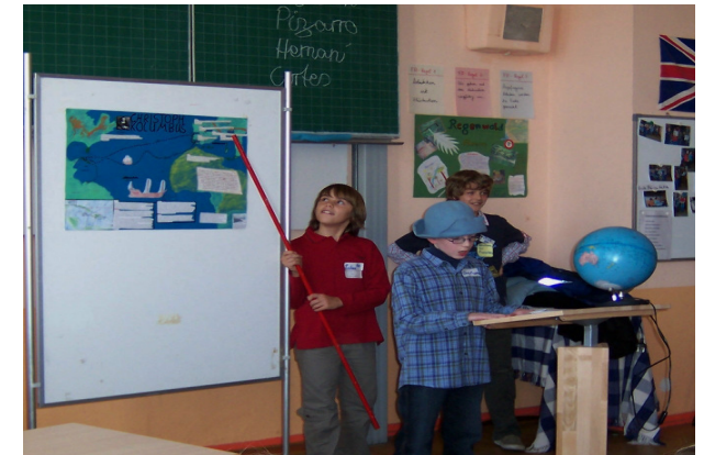
Präsentation zu Kolumbus (Vorführstunde Kl. 6)