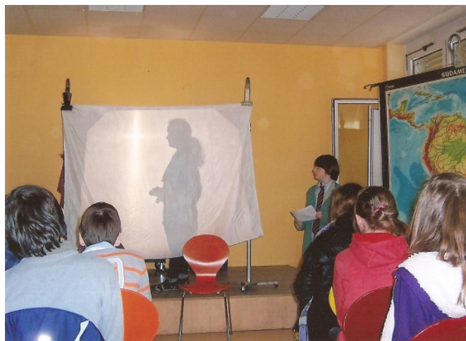
Abschluss einer fächerübergreifenden Projektarbeit in Kl. 7