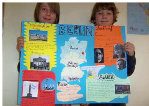
Recherche zum Thema Berlin (Kl. 5, Vorführstunde)