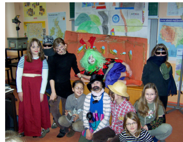
Vorführung Eulenspiegelei (Kl. 5)