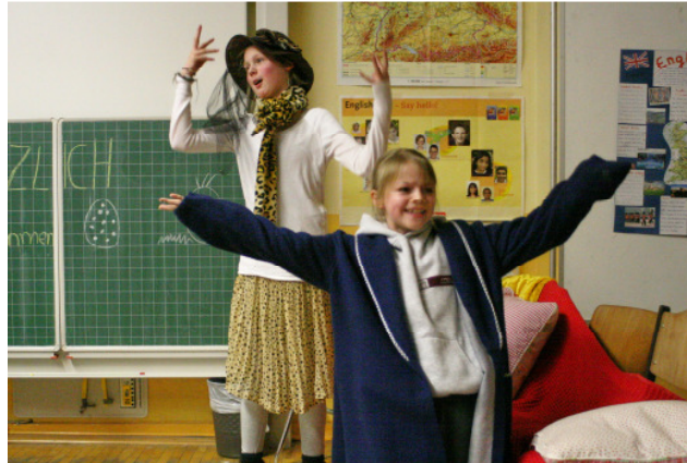
Vorführung auf einem Elternabend (Kl. 6)